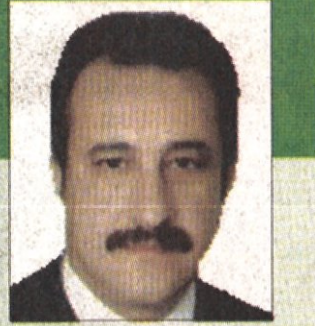
Fatih ve Küçükçekmece ilçelerinde çalışmalar devam etmektedir.

Türkiye Mühendisler Birliği İstanbul Şubesi, Yeni Deprem Yönetmeliği'nin 6 Mart 2007'de uygulamaya başlanması nedeniyle kamu ve özel sektör yöneticilerinin katılacağı bir toplantı düzenliyor.